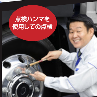
点検ハンマを 使用しての点検