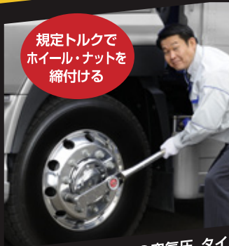
規定トルクで ホイール・ナットを 締付ける

タイヤ交換などホイール脱着時の不適切な扱いによる、 車輪脱落事故が発生しています！ 正しい取扱いをお願いします。 (確実な締付け作業)