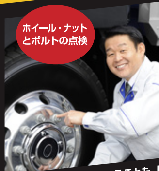
ホイール・ナット とボルトの点検