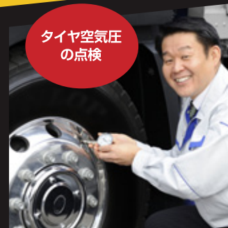
タイヤ空気圧 の点検

タイヤの空気圧、タイヤに亀裂や損傷、異状な摩擦がないこと、タイヤの溝の深さが十分あることも、しっかりと点検しましょう。